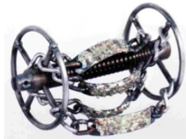
Abbildung: mit HM-Belag